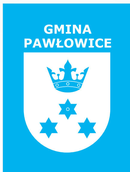
B. Wersja biała na niebieskim tle