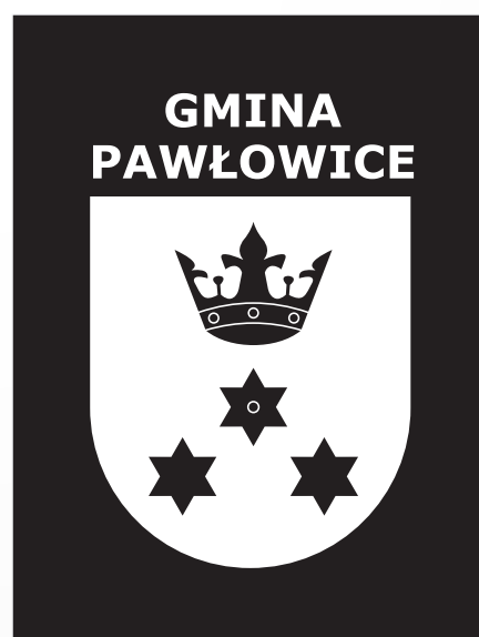
E. Wersja biała na czarnym tle