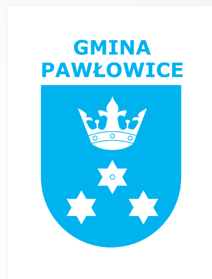
C. Wersja niebieska na białym tle