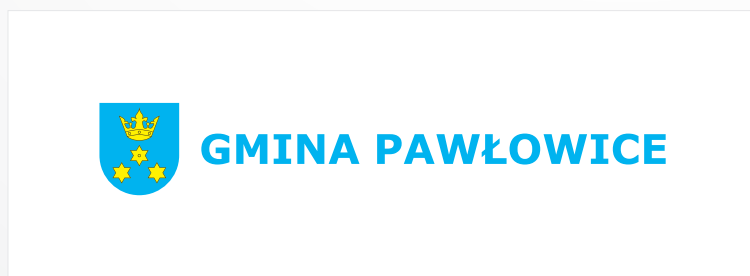
C. Wersja pozioma dłuższa