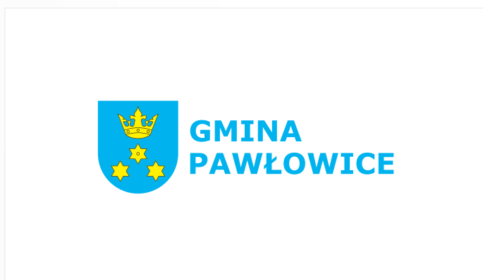
B. Wersja pozioma krótsza