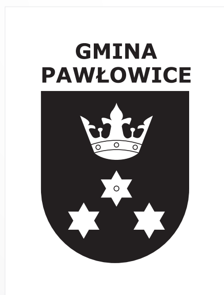
D. Wersja czarna na białym tle