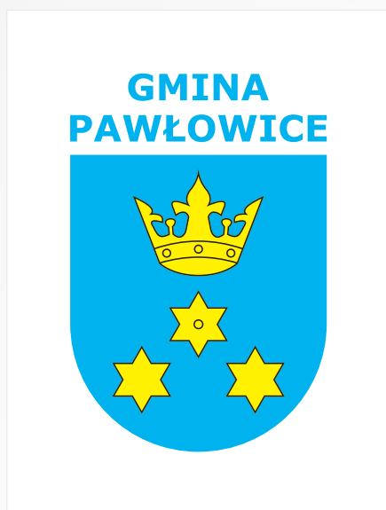
A. Wersja podstawowa

W sytuacjach gdzie technika nadruku nie pozwala wykonać nadruku w trzech kolorach, dopuszcza się stosowanie logotypu w jednym kolorze wg poniższego zestawienia