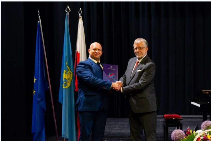
Inauguracja współpracy z Politechniką Śląską w zakresie samowystarczalności energetycznej